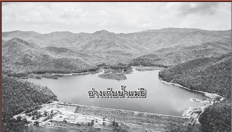
อ่างเก็บน้ำแม่ธิ

ดำรงไว้ซึ่งธรรมาภิบาล บริหารงานสู่มาตรฐาน