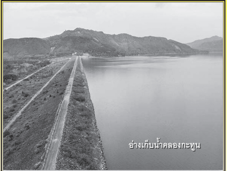
อ่างเก็บน้ำคลองกะทูน

เป็นสหกรณ์ออมทรัพย์ที่มั่นคง ดำรงไว้ซึ่งธรรมาภิบาล บริหารงานสู่มาตรฐาน